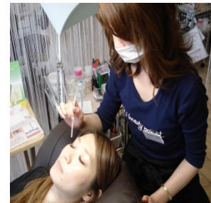
【これからの施術方法】