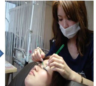
【これからの施術方法】